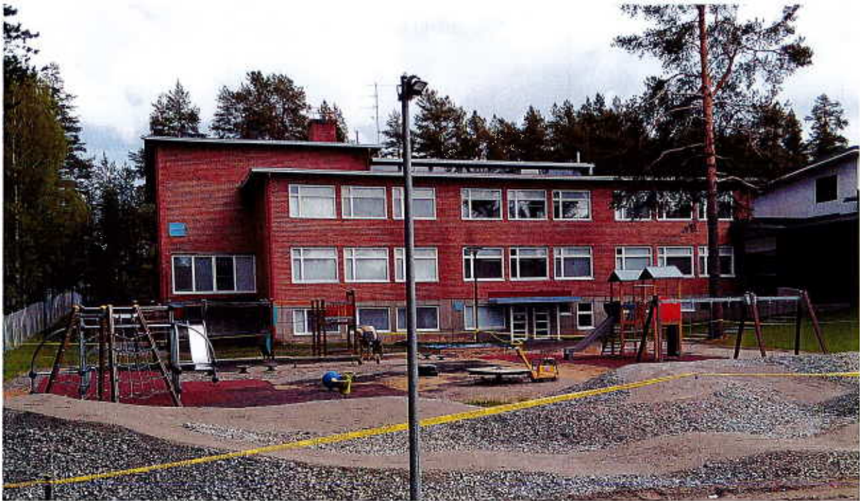
Lähiliikuntapaikka valmistuu kesällä 2019