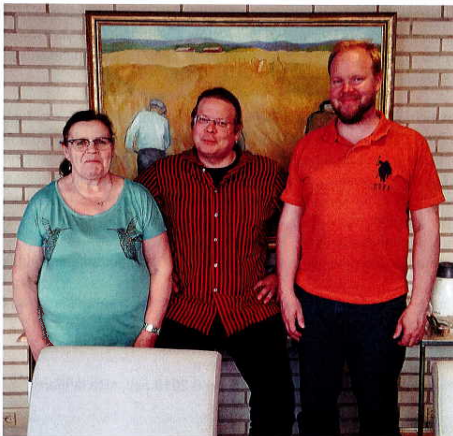
Tarkastuslautakunta 2018 - 2019

Tilintarkastusta on suoritettu ennalta laaditun työsuunnitelman mukaan. Tarkastuslautakunnalle on annettu raportteja tilikauden aikaisista tarkastushavainnoista.