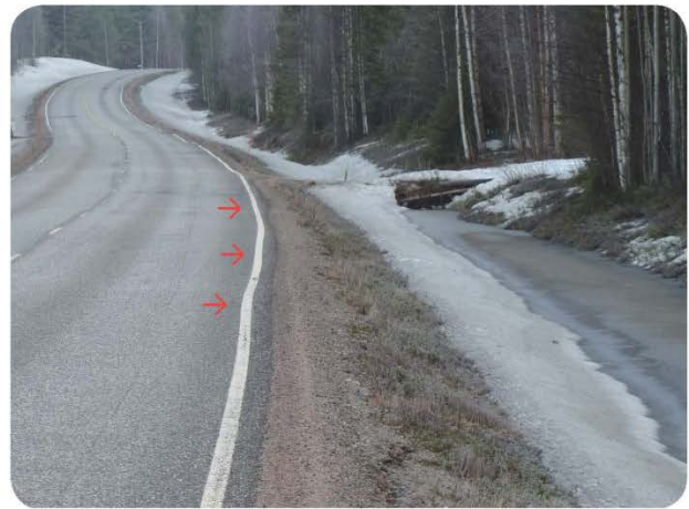
Mikäli veden virtaus estyy pitkään, imeytyy vesi tierakenteseen aiheuttaen esim. routaheittoja.