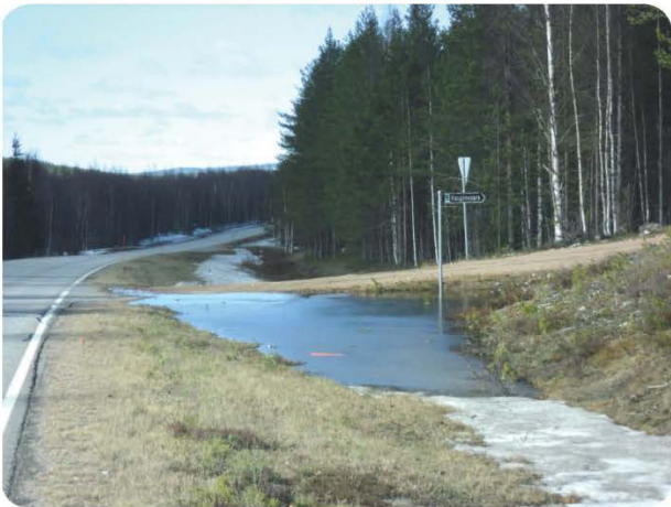
Jäätynyt rumpu estää veden virtaamisen ojassa ja vedet valuvat tielle.

Jos maantien varressa oleva rumpu on jäänyt ja sulamisvesiä on paljon liikkeellä eikä rumpua saada omin konstein vetämään, voi rummun omistaja olla yhteydessä elinkeino-, liikenne- ja ympäristökeskukseen (ELY-keskus). ELY-keskuksen kautta voi tiedustella aukaisuun soveltuvan kaluston tilaamista paikalle. Sama pätee tilanteessa, jossa rumpuun on kulkeutunut runsaasti sen toimimista estävää lietettä. Toimenpiteistä aiheutuneista kustannuksista vastaa liittymän haltija.